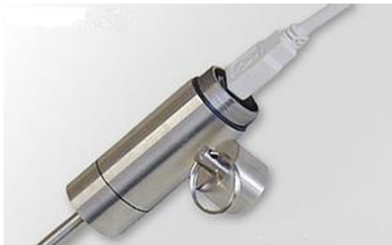
(数据下载连接方式)